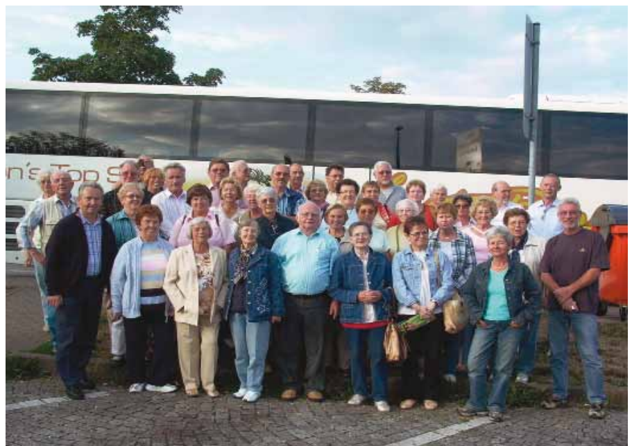
Die Teilnehmer der rundum gelungenen Reise

Das abwechslungsreiche Programm führte die Neuberger Seniorinnen und Senioren auf ihrer viertägigen Reise nach Göttingen und Hamburg – hier wurde u.a. auch das Musical „Der König der Löwen“ besucht. Die Stadt Cuxhaven sowie der Museumshafen Oevelgönne wurden ebenfalls besucht, bevor auf dem Heimweg auch der Stadt Hannover noch ein kurzer Besuch abgestattet wurde.