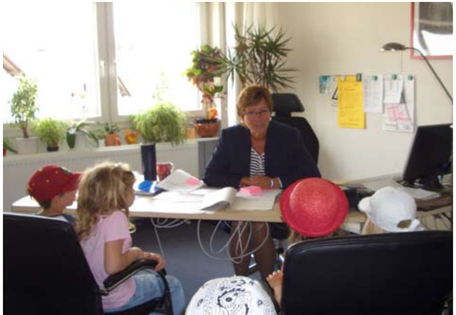
Die Schulanfänger informierten sich bei Bürgermeisterin Iris Schröder über eine mögliche Straßensperrung

Nun fahren dort ja keine echten Autos! Deshalb gingen die Kinder mit ihren Erzieherinnen auf Entdeckungstour in Rüdigheim und probierten das Gelernte aus. Am Bordstein stehen bleiben – nach links und rechts sehen – gerade, den kürzesten Weg über die Straße laufen – klappte schon recht gut. Aber immer wieder stellten sich neue Fragen: Was mache ich wenn Autos am Straßen-