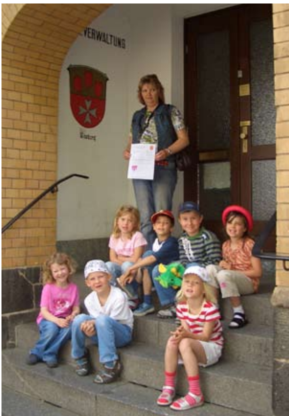
Geschafft! Die Genehmigung zur Straßensperrung ist erteilt

Auch Eltern sind an dieser Stelle aufgegriffen immer ein gutes Vorbild für ihre Kinder im Straßenverkehr zu sein und die täglichen Wege als Übung und zur Festigung des Wissens mit ihren Kindern zu nutzen!