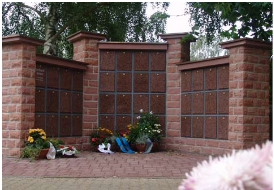
Auf dem Friedhof im Ortsteil Ravolzhausen steht seit Juni eine Urnenwand für Bestattungen zur Verfügung. Der Bau der Urnenwand war notwendig geworden, da aus Platzgründen auf dem Gelände des Friedhofs keine weiteren Urnengrabfelder ausgewiesen werden können.