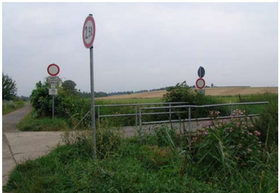
Ab sofort für Fahrzeuge gesperrt: Die Krebsbachbrücke am Rüdigheimer Hundeplatz

Aus Sicherheitsgründen wird die Krebsbachbrücke am Hundesportplatz im Ortsteil Rüdigheim für den Fahrzeugverkehr gesperrt und ist ab sofort nur noch für Fußgänger und Radfahrer sowie für