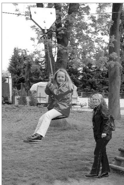
Seit Jahren ein Renner: Die Seilbahn auf dem Spielplatz Bergstraße

Idyllisch präsentiert sich der Spielplatz in der Bergstraße: am Hang gelegen, mit vielen alten Bäumen und zahlreichen wild wachsen-