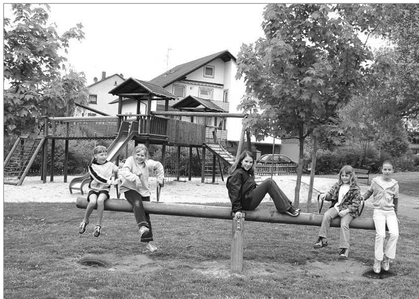
Großes Spielhaus, Wippe und viel Grün: der Spielplatz in der Limesstraße

Idyllisch präsentiert sich der Spielplatz in der Bergstraße: am Hang gelegen, mit vielen alten Bäumen und zahlreichen wild wachsen-