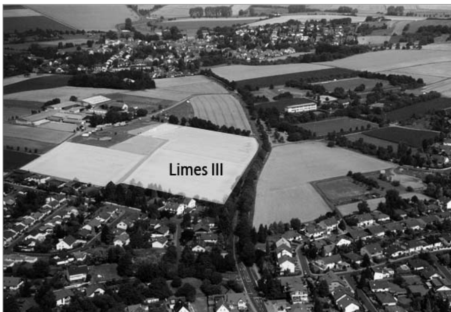
Baugebiet Limes III: Auf einer Fläche von 5,3 ha entstehen etwa 55 neue Bauplätze.