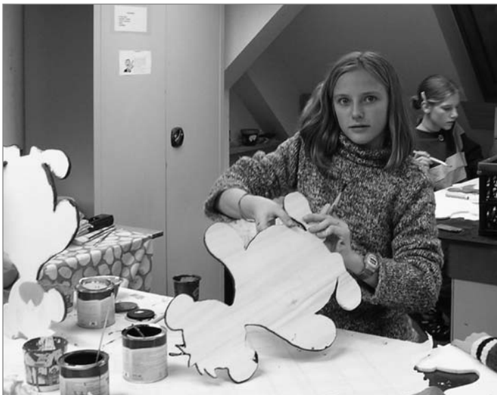
In der Kinder- und Jugendwerkstatt ist noch echte Handarbeit gefragt

Wer Interesse an weiteren Angeboten der Jugendpflege Neuberg hat kann sich auch im Internet auf der Website der Gemeindeverwaltung unter www.gemeinde-neuberg.de/jugendzentrum informieren.