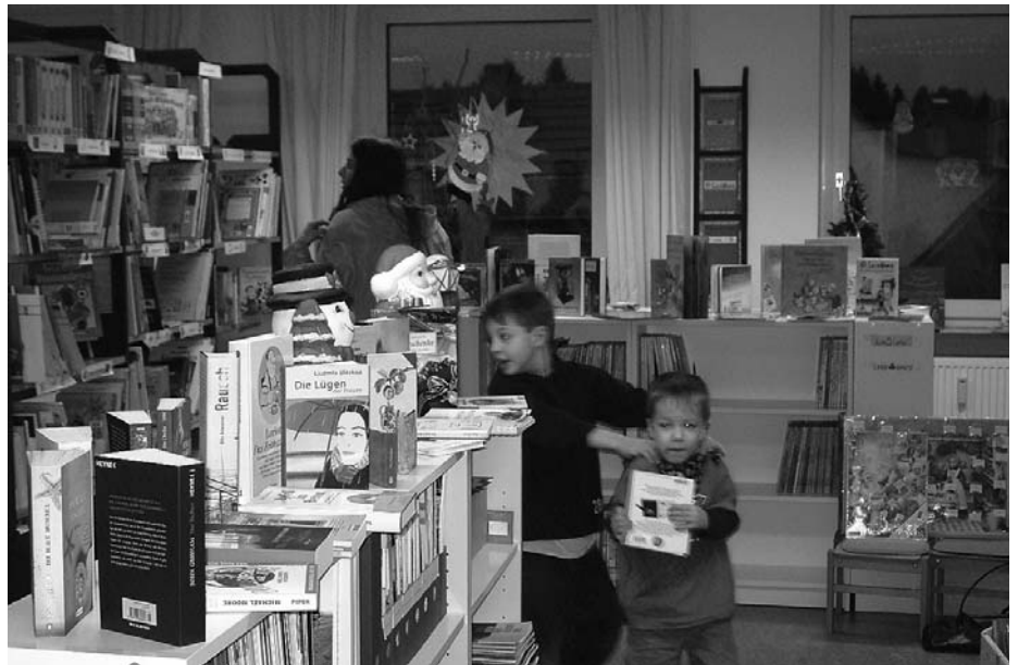
Auch im Jahr 2004 hält die Gemeindebücherei wieder interessante Neuerscheinungen für ihre großen und kleinen Besucher bereit

Sehr beliebt bei den Kleinen ist das Vorlesen oder auch das Bilderbuchkino. Damit auch erwachsene Leser nicht zu kurz kommen, haben wir wieder am Tag der Bibliotheken eine Autorenlesung angeboten, die sehr gut besucht war und in stimmungsvoller Atmosphäre stattfand. Die Buchausstellungen in Verbindung mit dem Buchladen „Michler & Weber“ boten die Möglichkeit, sich in den Räumen der Bücherei einige der Neu-